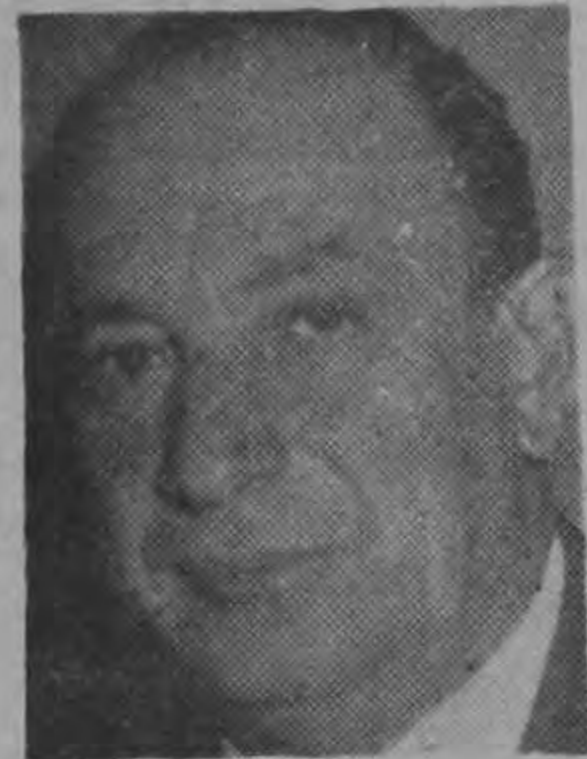
FRANCISCO J. ORLICH.