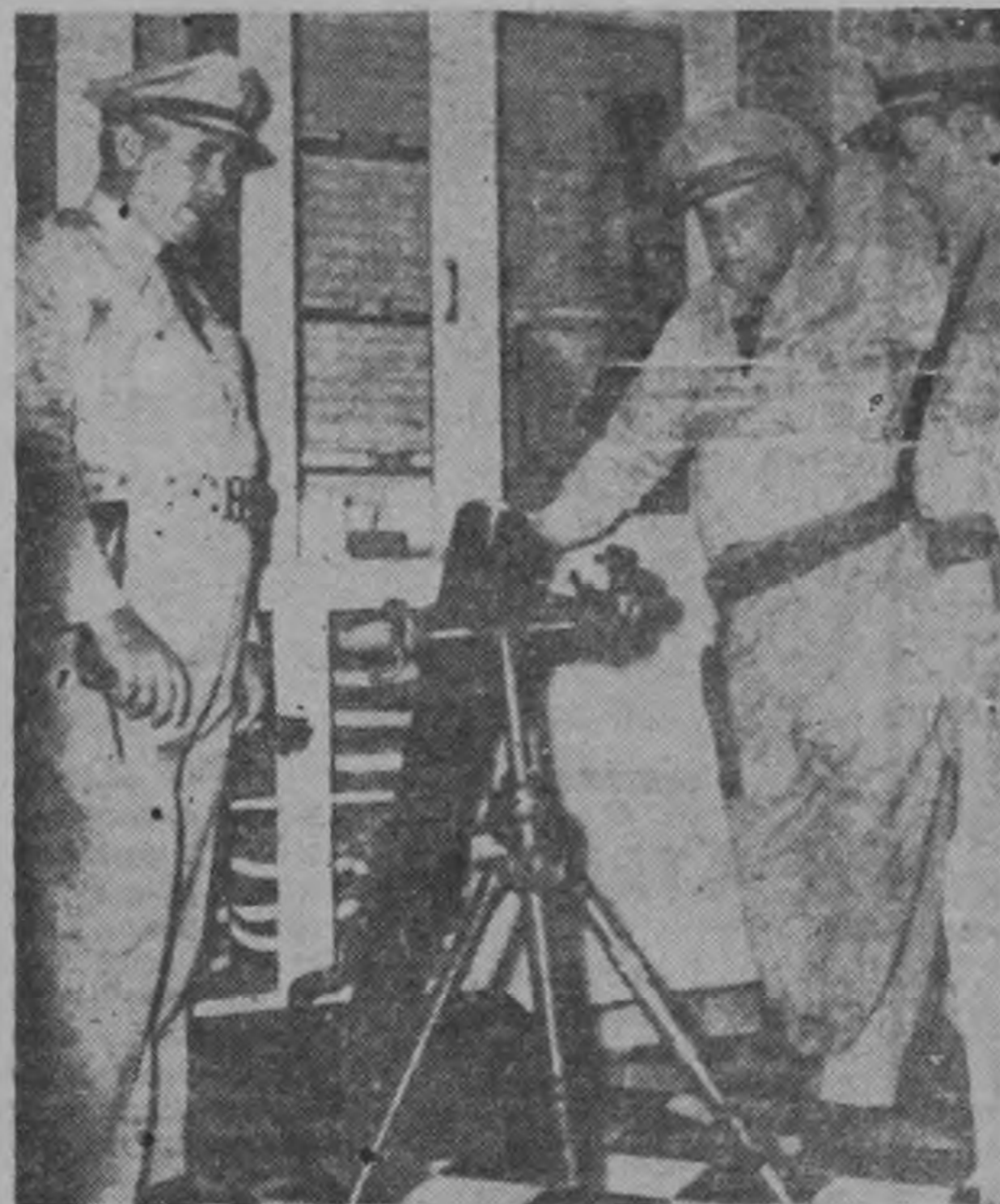
Pueblo inerme contra ejército armado... Tabernilla, símbolo de la opresión, revisa armas que se usarán, como en Hungría, contra los patriotas que luchan por la libertad...

El mundo democrático espera el triunfo de la revolución de Fidel Castro. Y como no podía ser menos, el de los más caros postulados que deben hacerse reales para una nación que encontró al fin juenes acompañarán a las palmeras que parecían "novias que esperan", encontraron su amor: los libertadores.