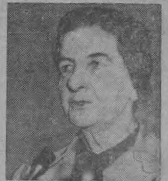
MINISTRO GOLDA MEIR ... A Washington...