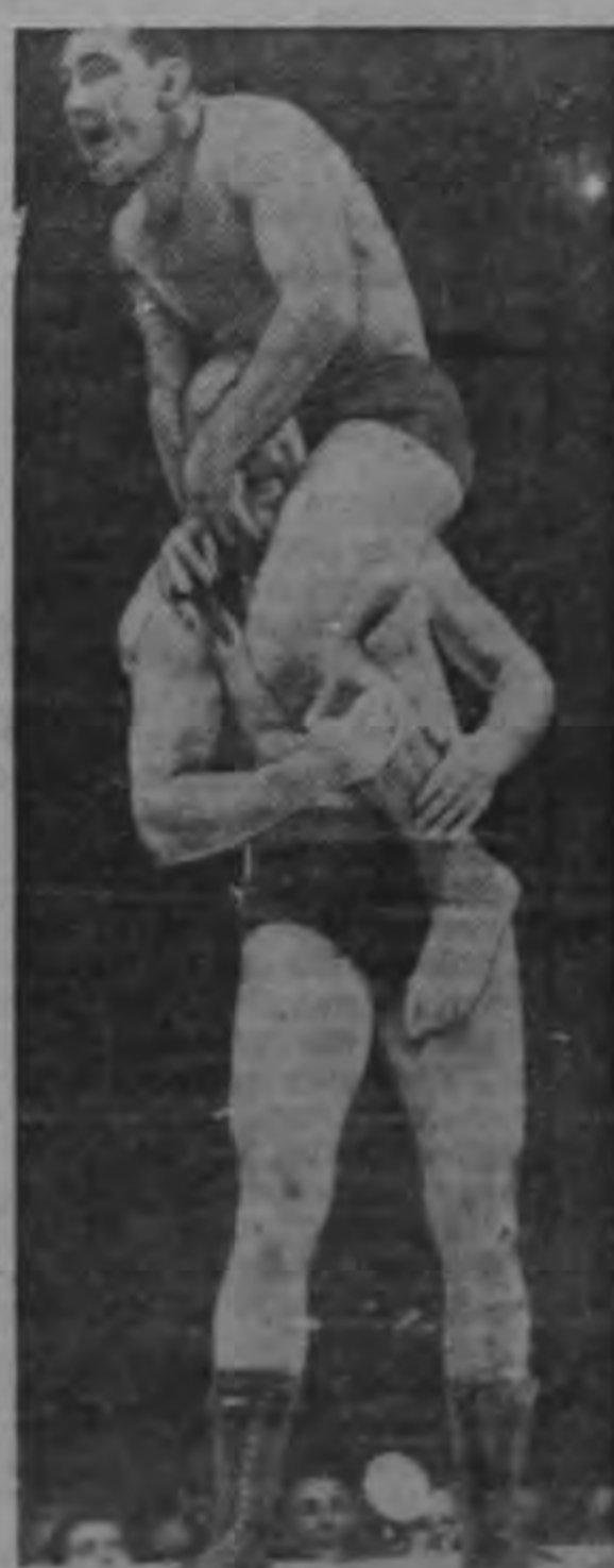
Antonio Rocca luchador argentino, aplica una llave a su contrario Hans Schmidt (abajo) de Chicago, en un partido en el Madison Square Garden, N. York. Rocca ganó la lucha.