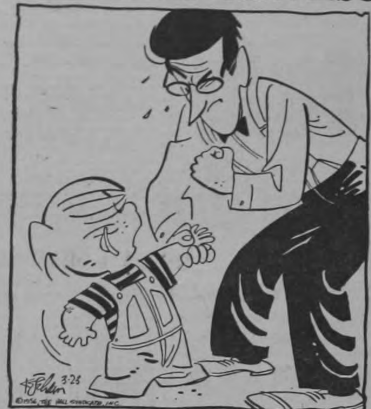
¿No le vas a pegar al hijo de tu propia sangre, no es verdad?