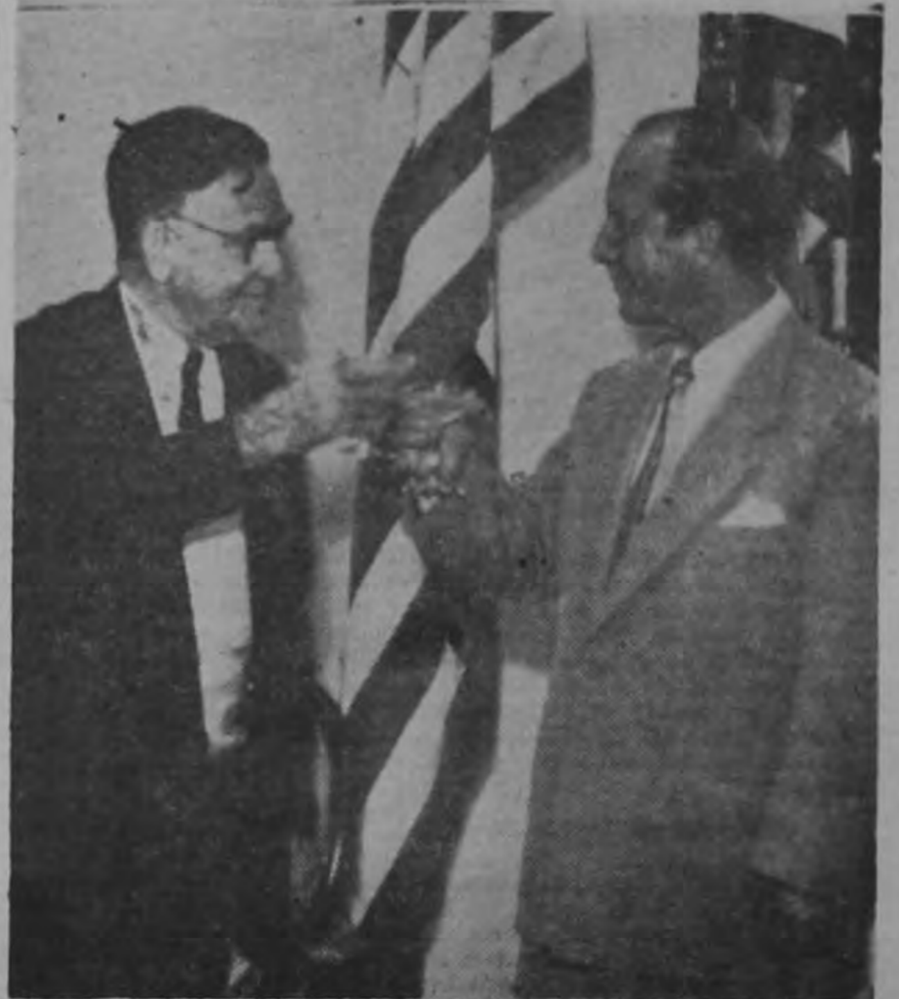
Ex-Embajador Davis brinda con el Ministro Gámez, Encargado del Ministerio de Relaciones Exteriores.

El 14 de marzo de 1922 se hacía acreditar como representante del Gobierno de los Estados Unidos en Costa Rica donde convivió con los costarricenses por 7 años. Su cariño a esta tierra lo llevó a bautizar a su hija Mercedes Tica.