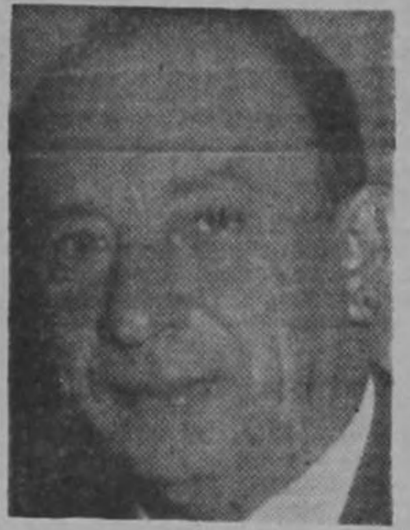
Francisco J. Orlich.