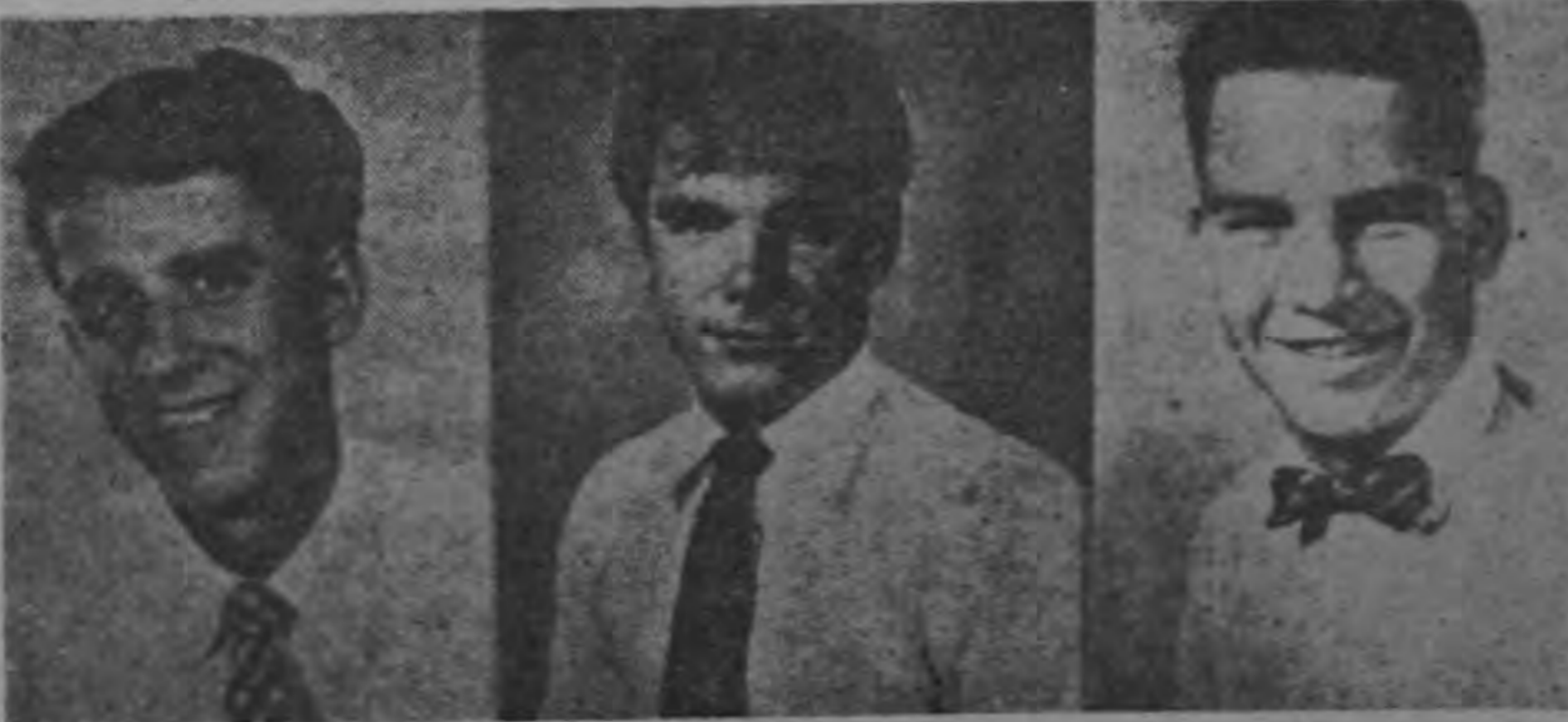
Estos tres adolescentes se dice que se unieron al movimiento patriota de Fidel Castro. Estaban en la base norteamericana de Guantánamo. Han ejemplarizado con su digna actitud... Norteamérica da su valiosa ayuda. Los jóvenes son todo un símbolo.

El Presidente Batista ha ordenado reforzar la Guardia del Palacio por temor a un nuevo ataque suicida de los estudiantes universitarios y elementos pertenecientes al movimiento 26 de julio que dirige Fidel Castro desde las montañas de la Sierra Maestra en la Provincia de Oriente.