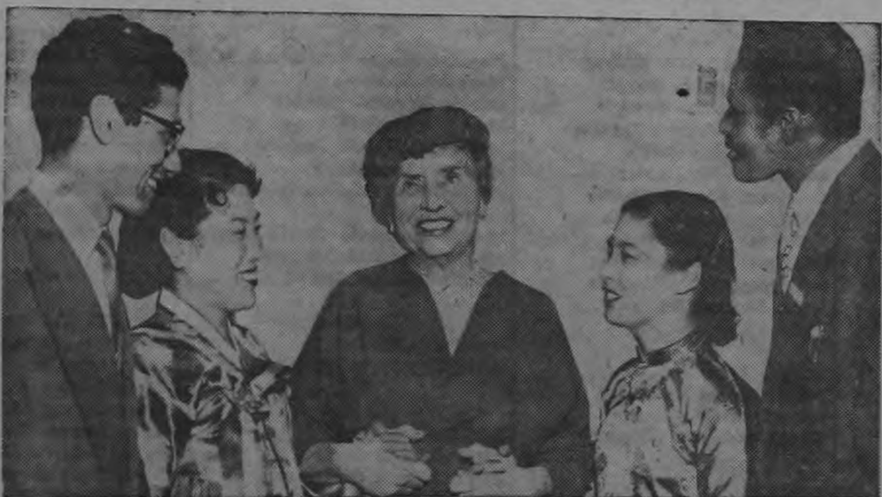
Futuros trabajadores para los ciegos de países extranjeros conocen a Helen Keller, famosa humanitaria ciega y sorda. Los cuatro estudiantes forman parte de un grupo de becados que asisten a un seminario de estudiantes extranjeros patrocinado por la Fundación Norteamericana para Ciegos INF