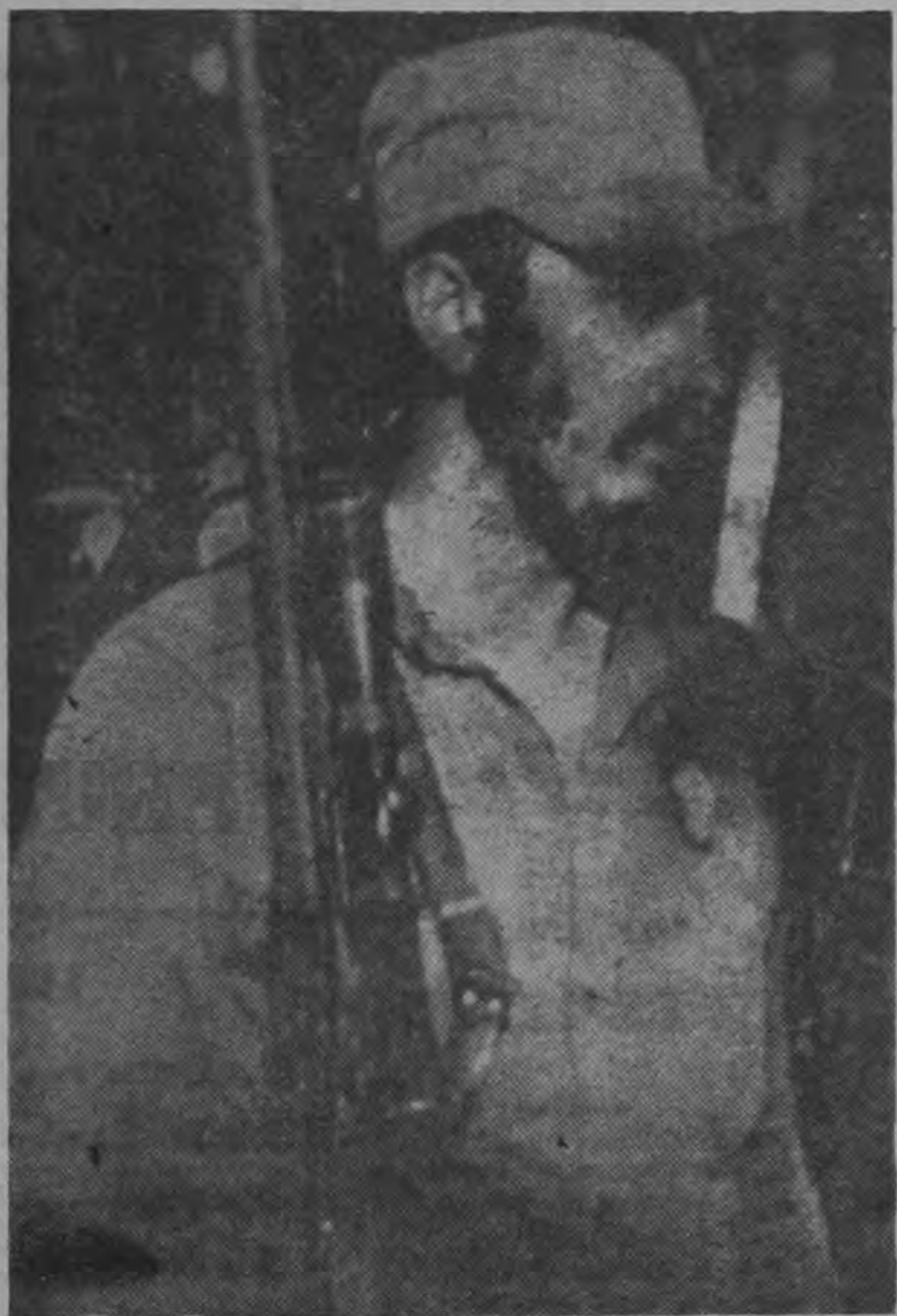
Las palmeras de Cuba parecían novias que esperan... Al fin encontraron su amor: los libertadores. Pero todavía Cuba es un país ocupado por su propio ejército

cación. Los hermanos norteamericanos, vibran al unísono hoy con el problema cubano. Les preocupa lo que allí sucede. No bastándoles el que sus periodistas y sus hombres de pensamiento se estén uniendo a la voz general que grita que Batista debe irse para que haya paz en Cuba, estos tres jóvenes, con gesto digno de admiración, expresan su amor por Cuba; pero antes que esto, su amor por la libertad; por go biernos como los quería el flaco, alto y paternal Lincoln; del pueblo, para el pueblo y por el pueblo.